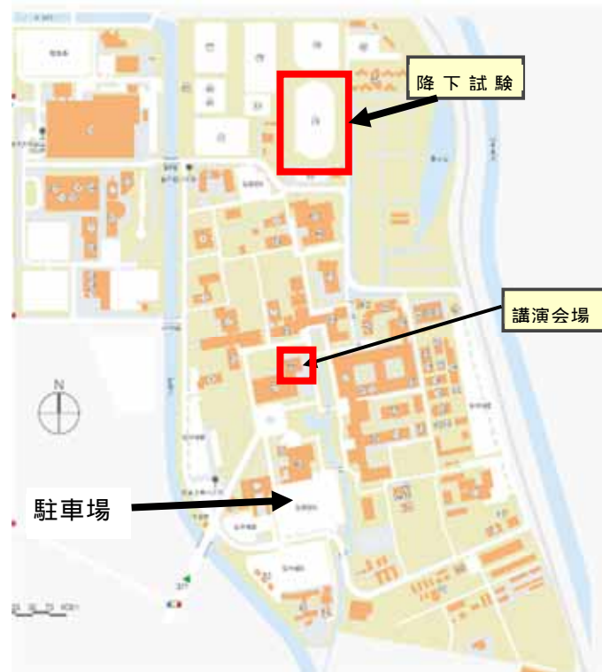
岐阜大学 陸上競技場 見取り図

お問合せ先 「理数が楽しくなる教育」実行委員会事務局（和歌山大学宇宙教育研究推進室内）